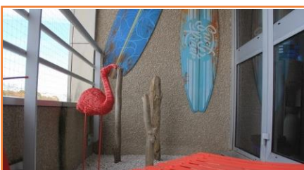
De la couleur au balcon & Design à l'hôpital