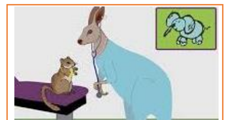
Mieux s'orienter en consultation ORL/OPH pédiatrique